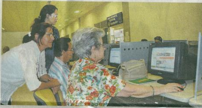
En la biblioteca pública del Centro Lucy Tejada, así como en el Sena y algunas universidades se capacita a los mayores de quince años para ser ciudadanos digitales, enseñándoles el acceso a las nuevas tecnologías y su correcta utilización.

En los últimos cuatro años los jóvenes emprendedores de ParqueSoft han obtenido cuatro premios mundiales.