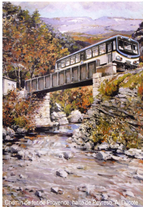
Chemin de fer de Provence, halte de Peyresq, A. Ducote

Territoires des savoirs en Europe Le patrimoine au service du territoire, nouveaux enjeux ?